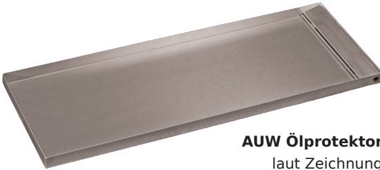
AUW Ölprotektor laut Zeichnung