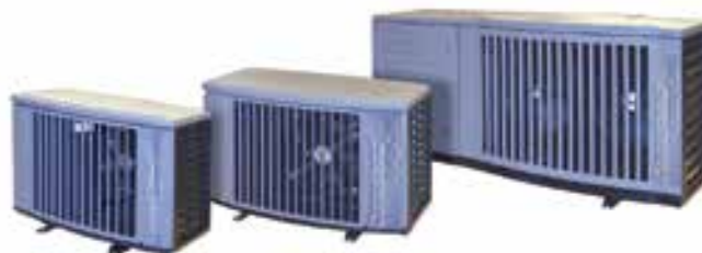
Copeland EazyCool-Verflüssigungssätze zur Außenaufstellung mit Scrollverdichtern